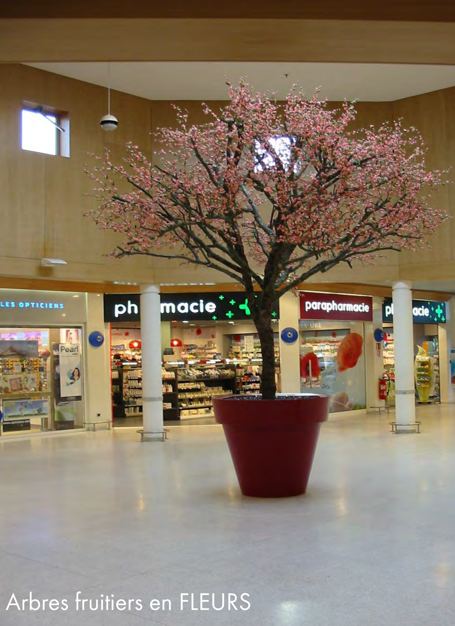
Arbres fruitiers en FLEURS