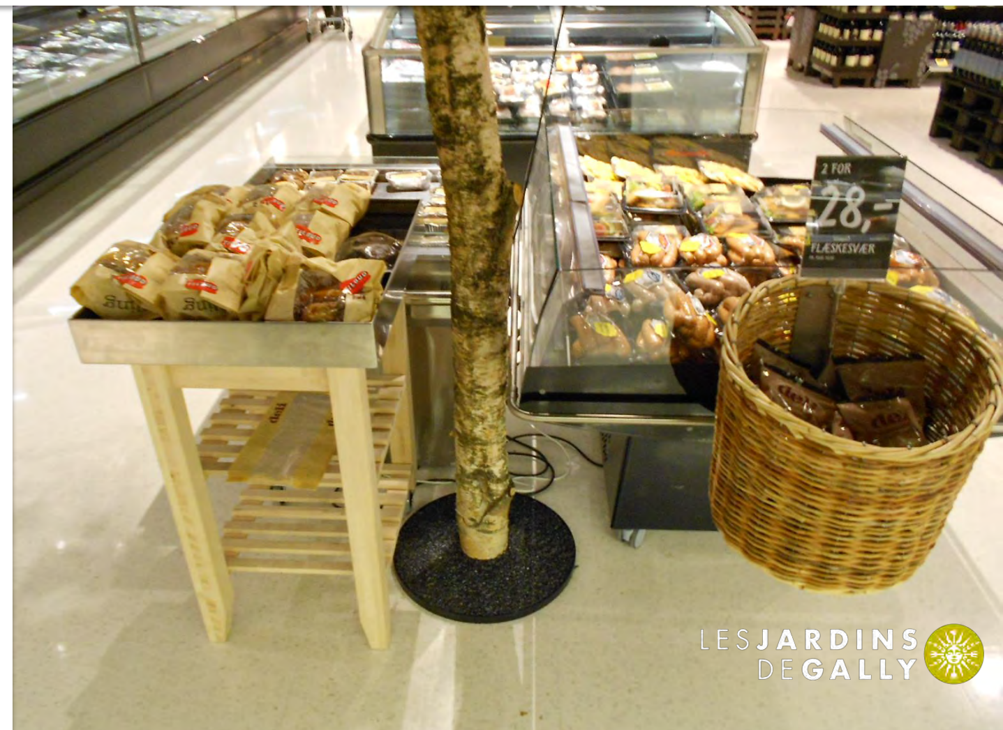
Arbres rayons Fruits et légumes BOULEAU et ARBRE en BAIES ROUGES