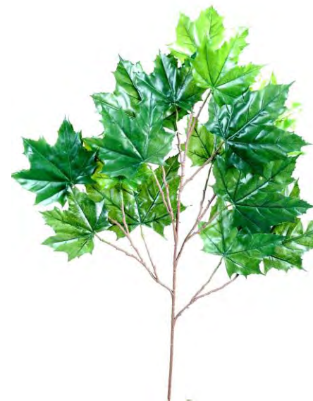
Platane (été ou automnale)