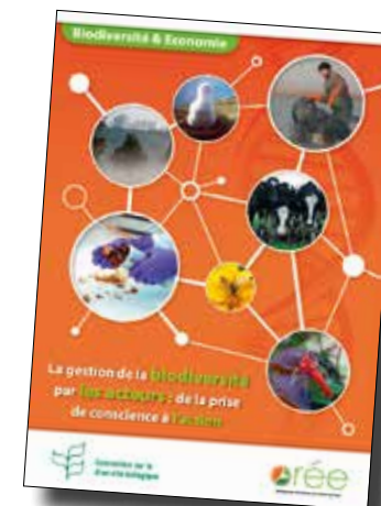
Guide biodiversité et entreprises. Études de cas sur les éco-contracts des Jardins de Gally (2013).