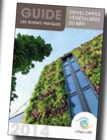
Guide des bonnes pratiques enveloppes végétalisées du bâti. Coordonné par les Jardins de Gally (2014).